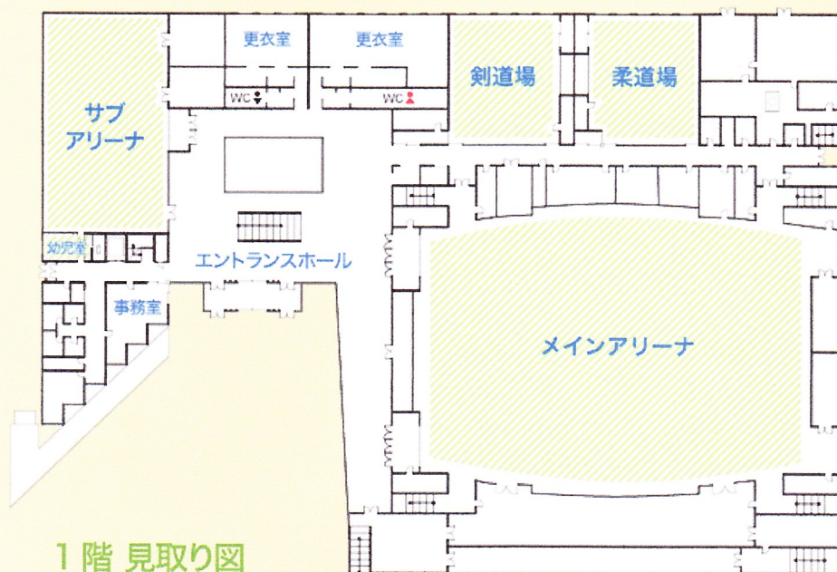
1 階 見取り図