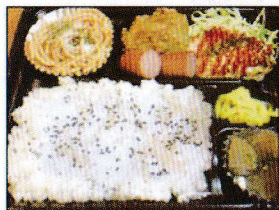
からあげ・ソーセージ ミニハンバーグ 550円