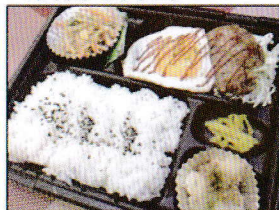
一例) 目玉焼きハンバーグ弁当 450円